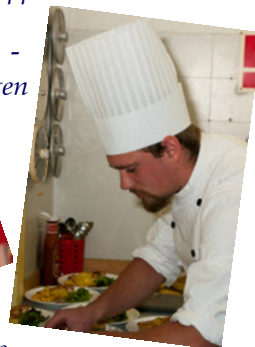
Det er vigtigt at holde hovedet oven vande ...