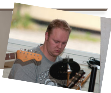
Vores dygtige - og engagerede - lovsangsgruppe